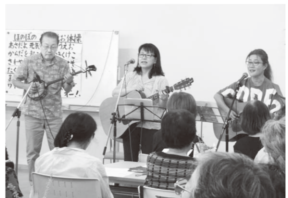
音楽タイムで演奏するメンバー

RUN伴は認知症になっても安心して暮らすことのできる地域になることを目指し、認知症の人と一緒に行動するタスクリレーです。今年も南は向陽苑から北はサニーリッジをスタートし福祉会館で合流、府総合庁舎をゴールとするコースで行われました。スタート時は曇りでしたが途中小雨の中のタスクリレーとなりました。 医誠会診療所職員3人とここにオレンジカフェから4人が走りまわりました。南コースの休憩地点の医誠会診療所前には11時40分ごろに着き、応援の職員やオレンジカフェスタッフの出迎えを受け休養後、記念撮影し、ゴールに向かって出発しました。 ※写真は表紙に (高木)