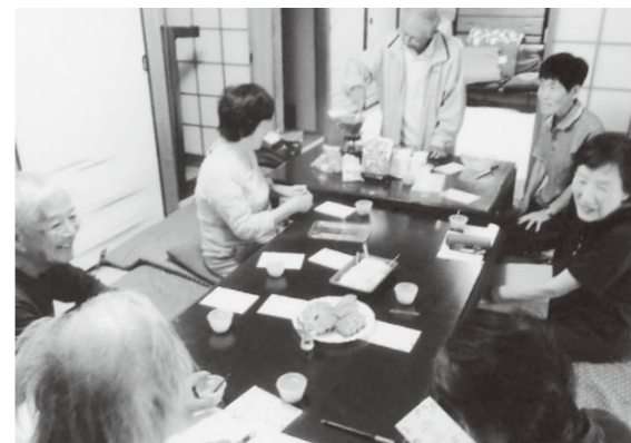
趣味の話で盛り上がる

国の調査などでは、高齢者が家に閉じこもり状態では、身体能力が低下するといわれており、趣味活動が