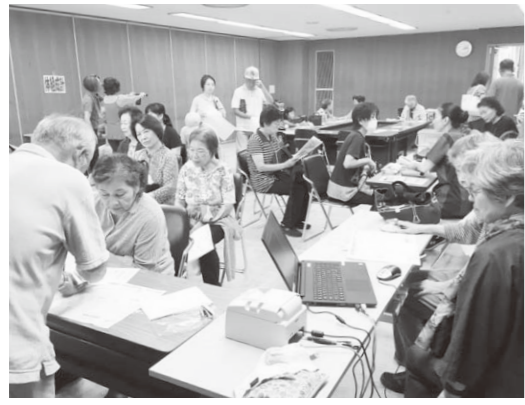
大にぎわいの西京健康チェック

10月1日(火)に事業所では、未加入の利用者・患者さんへ加入をすすめる「利用率100%デー」に取り組みました。通所リハビリほのぼのクラスでは、「職員さんによくして