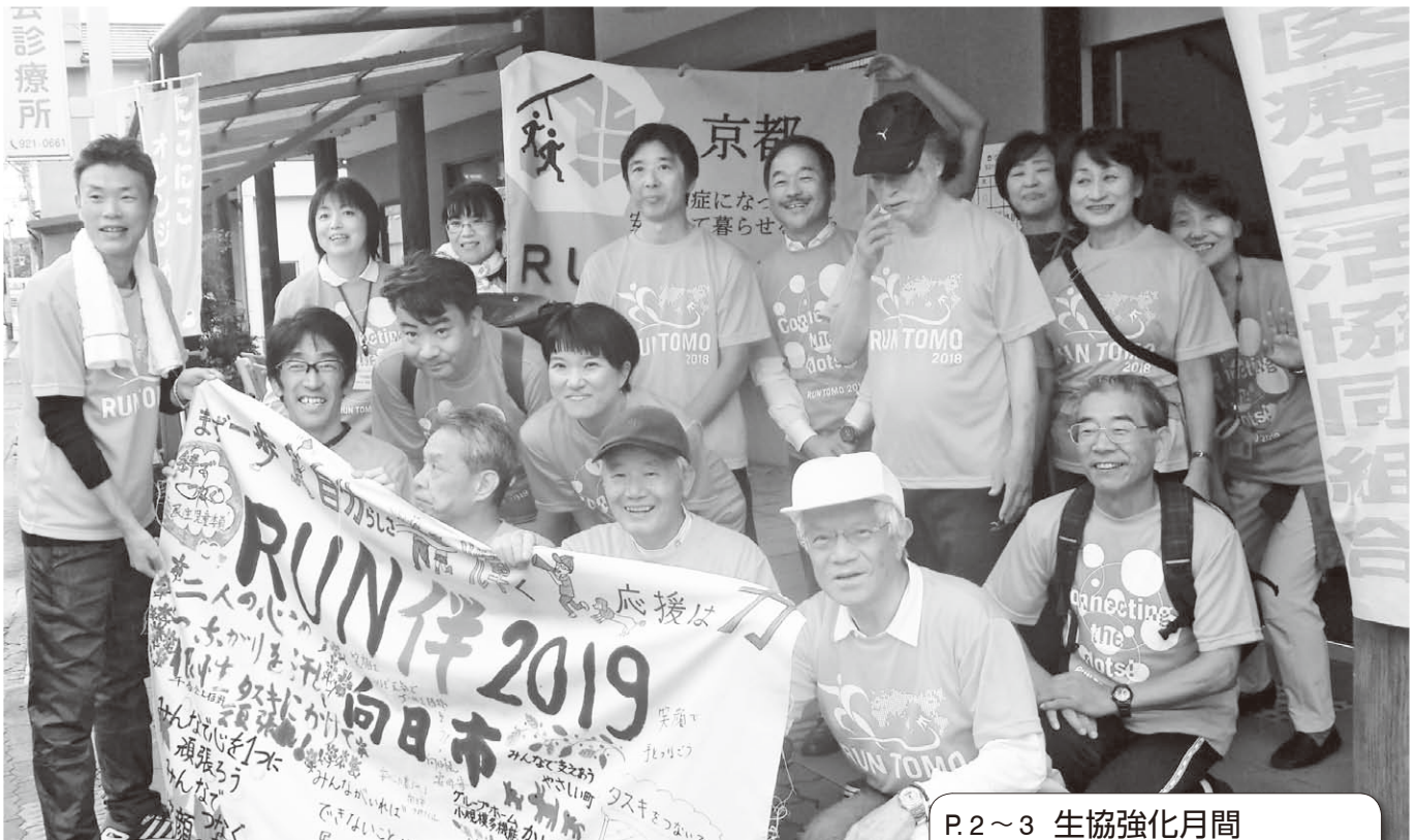
ランドモ RUN伴 (認知症啓発キャンペーン)

ホームページ http://www.otokuni-hcoop.com Eメール info@otokuni-hcoop.com